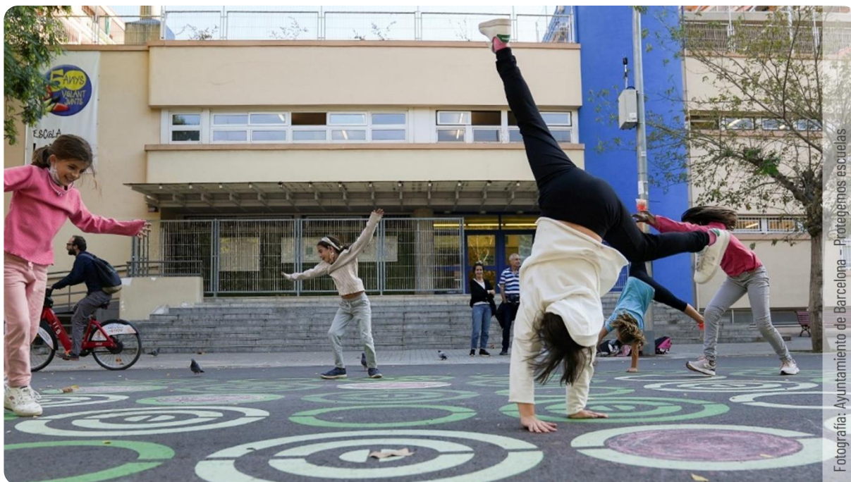
Protegemos escuelas

9 mayo 2024 a 25 julio 2024 Jueves de 18h a 20h (CEST/CET)